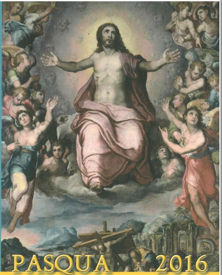
Immagine: Tomo mediceo e Cristo in Gloria (Marco di Pino detto Marco di Sanse) Pinacoteca dei Musei Vaticani